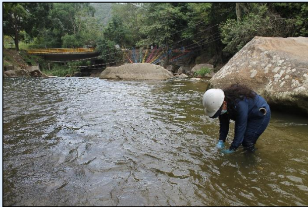
Toma de muestra para Oxígeno Disuelto