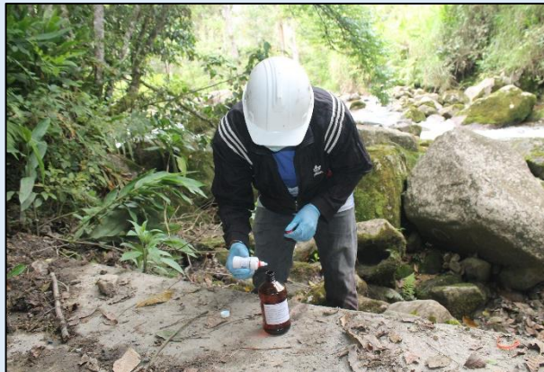
Preservación de muestra para Demanda Química de Oxígeno- DQO