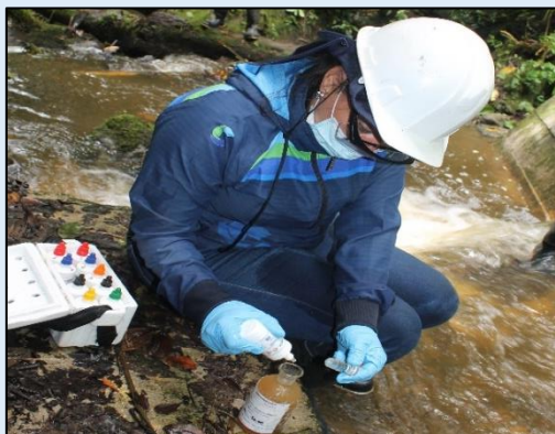
Preservación de muestra para ensayo Oxígeno Disuelto