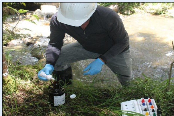
Preservación de muestra para Demanda Química de Oxígeno- DQO.