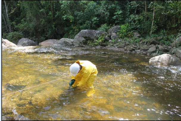
Toma de muestra para ensayos microbiológicos.