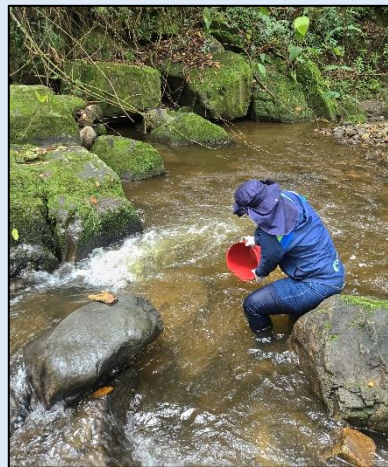
Toma de muestra para ensayos fisicoquímicos