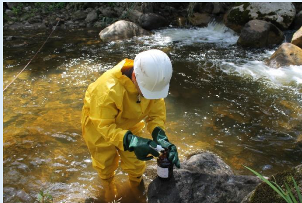
Preservación de muestra para ensayos fisicoquímicos.