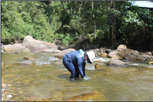
Toma de muestra para ensayos microbiológicos.