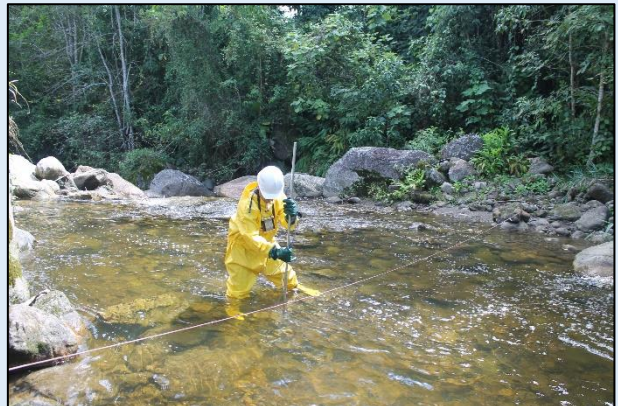
Medición del Caudal.