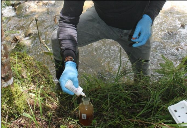
Preservación de muestra para Oxígeno Disuelto