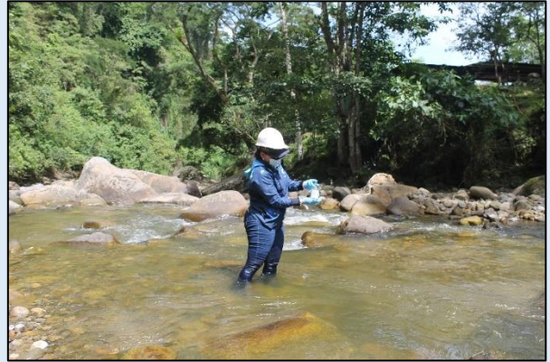
Toma de muestras para Oxígeno Disuelto