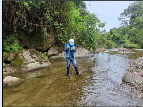
Medición del Caudal.