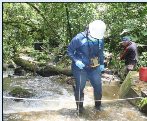
Medición del Caudal.