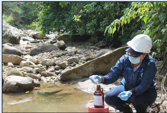
Preservación de muestra para el parámetro de Nitrógeno Total- NT