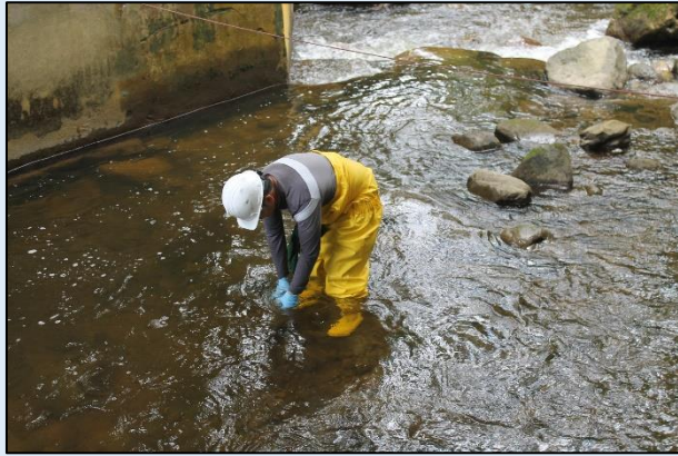
Toma de muestra para ensayos microbiológicos.