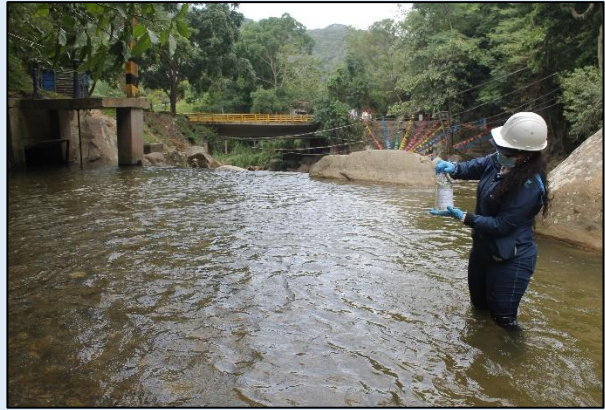
Toma de muestra para análisis Microbiológicos