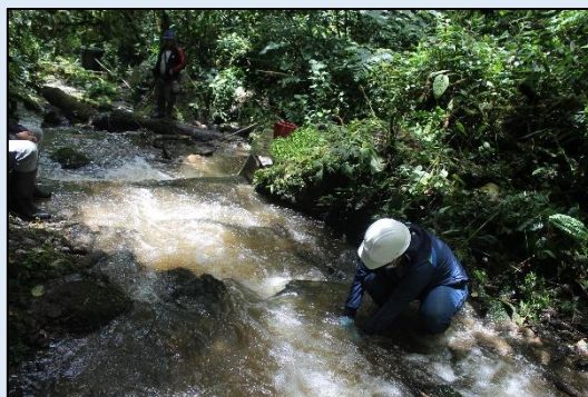
Toma de muestra para análisis de ensayos microbiológicos.