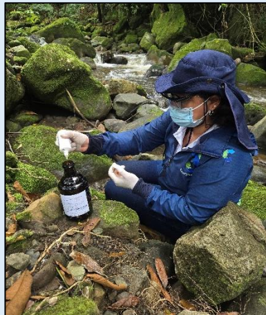
Preservación de muestra para ensayos fisicoquímicos.