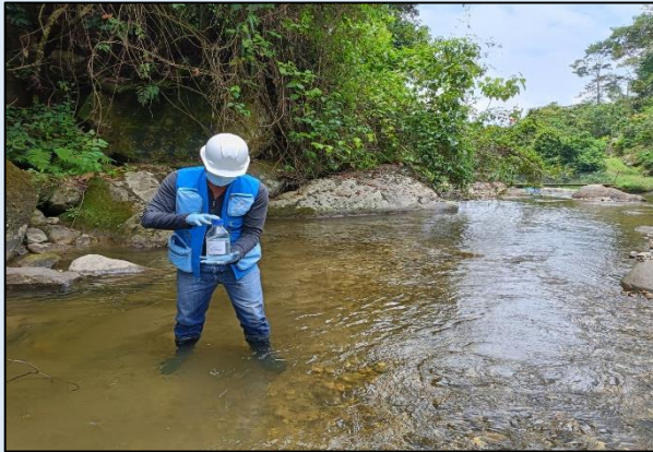
Toma de muestra para análisis microbiológicos.