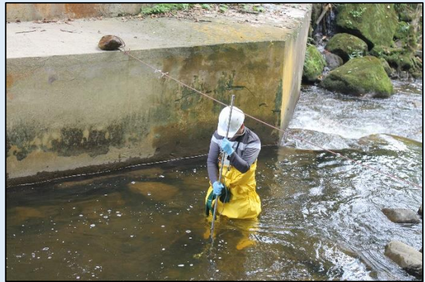
Medición del Caudal.