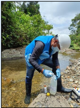
Preservación de muestra para ensayos fisicoquímicos