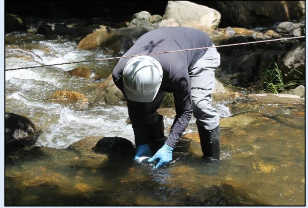
Toma de muestra para ensayos microbiológicos