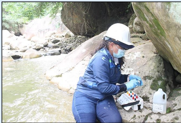
Preservación de muestra para análisis de parámetros fisicoquímicos.